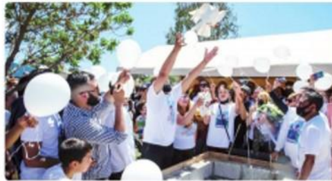
PLAYAS DE ROSARITO.- Se trató de un conmovedor proceso fúnebre el que tuvo lugar este jueves en el ejido Mazatlán.

Gran cantidad de personas acudió al panteón municipal del ejido Mazatlán, donde descansarán los restos del menor de apenas 12 años, cuyo cadáver fue localizado justo a un arroyo con brutales communitas y heridas