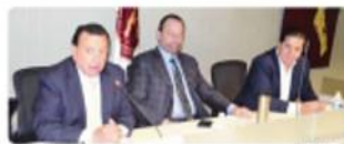
TIJUANA.- El plan busca generar las condiciones para lograr el bienestar de los niños y jóvenes del Estado.